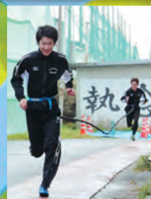
陸上選択者トレーニング