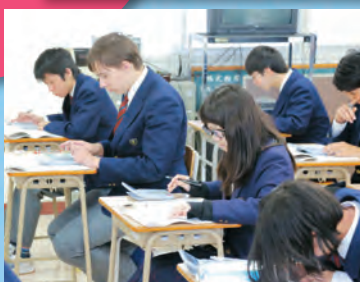
課題研究で必死の電卓計算