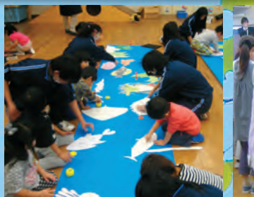
保育園児と共同制作