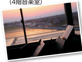
▼ある春の夕暮 (4階音楽室)