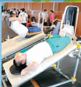
柔道選択者の体力作り