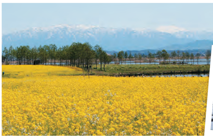
豊高近くの北蒲原最後の湿地「春の福島潟」 (豊高EVENT、部活動ページ背景)