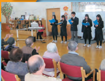
介護施設の演奏訪問