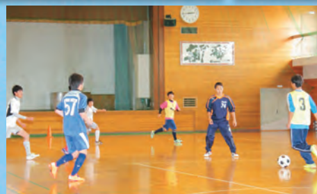
サッカー選択者室内練習