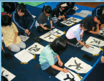
保育園児に書の指導