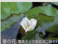
菱の花(豊高近くの福島潟に咲く)

④ 菱の花 咲けばなつかし 光吹く風 ふるさに満ち 豊栄 豊栄 わが母校 望みてゆかん 遙かなるもの