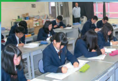
英語のプリント学習