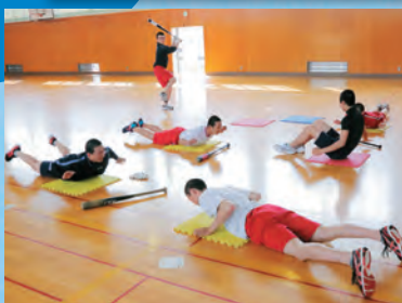
野球選択者トレーニング