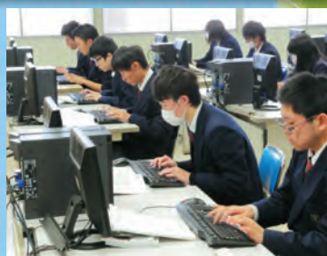
情報処理で打ち込み速度が上昇